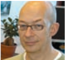
TEKST: JON AALBORG ILLUSTRASJON: SOLVEIG SERIGSTAD HAUGE

Vår misjon på jorden, vårt oppdrag, er å gi mennesker dette håpet. Det finnes mange måter å gjøre det på. Vi kan gå ut; vi kan bli der vi er. Vi kan handle, som Kristi hender og føtter, eller vi kan tale, som hans stemme. Vi kan heise flagget, eller vi kan tilbe Gud i stille tillit til at hans Ånd virker det den vil. Vi er Kristi vitner, uansett, så lenge vi peker på ham. Og se, han er med oss alle dager, inntil verdens ende.