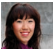
TEKST: SILJE KVAMME BJØRNDAL ILLUSTRASJON: SOLVEIG SERIGSTAD HAUGE

Å samtale med Jesus kan for øvrig vise seg å være en nokså utfordrende aktivitet. Ikke bare for hodet, men også for hjertet. En annen gang sier han til en fremadstormende kar med hus, hytte og båt; ”Vil du være helhjertet, gå da bort og selg det du eier, og gi alt til de fattige. Da skal du få en skatt i himmelen. Kom så og følg meg!” (Matt 19,21)