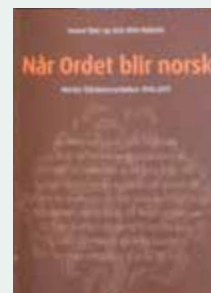
Når Ordet blir norsk Sverre Bøe og Geir Otto Holmås, Tapir Akademisk Forlag (2012)

– Det er et symptom på at Bibelen fortsatt er en viktig bok i vårt land.