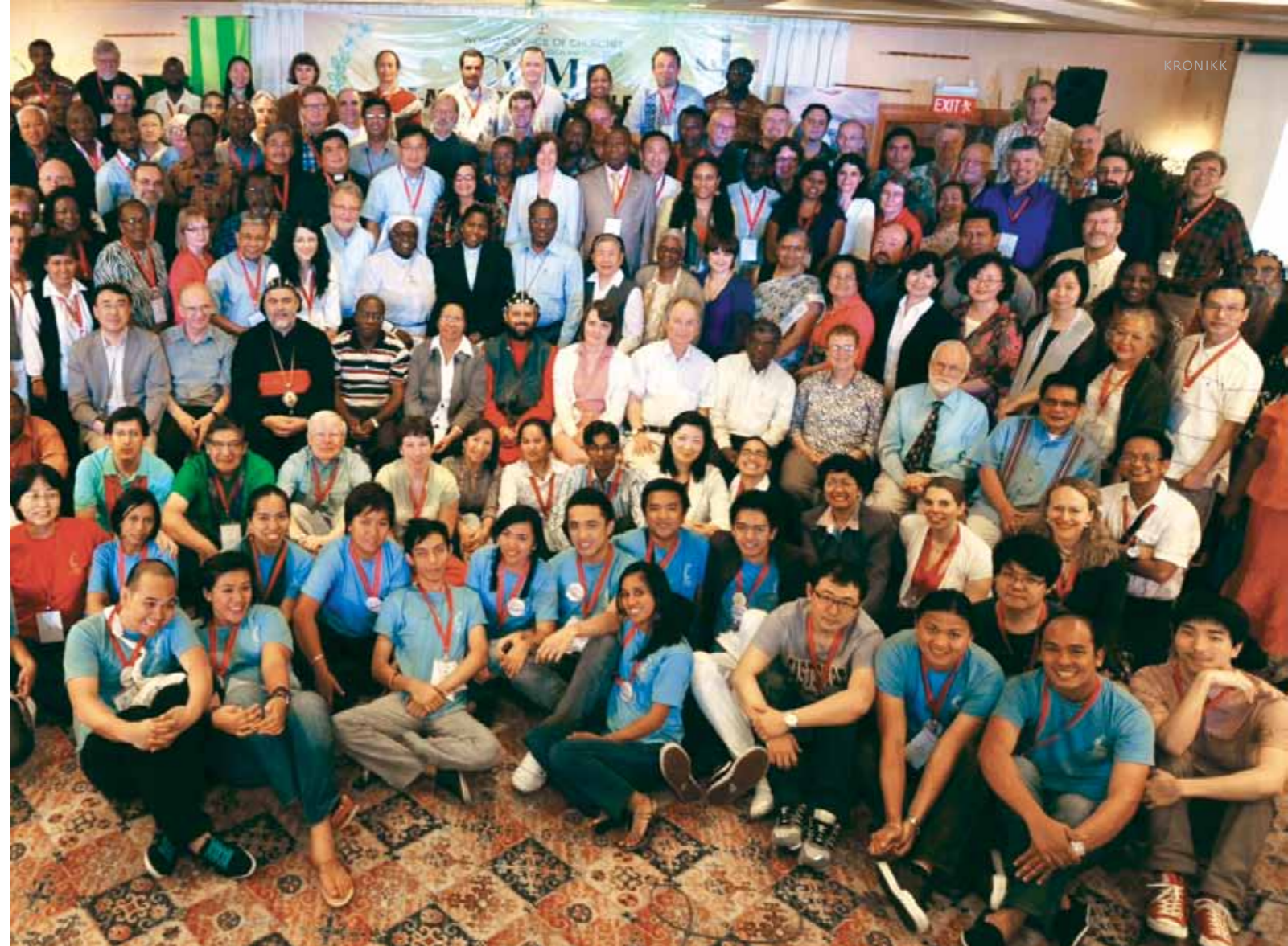
Hva er misjon i dag? Dette spørgsmålet drøftet godt over to hundre kirkeledere og misjonsteologer fra hele verden på en misjonskonferanse i Manila i mars i år.

Efter sin død og opstandelse sender Jesus sine disciple til verdens ende. Kirken sendes således til verdens ende for at fortsætte den mission som de har fået af ham som har udsendt dem. Kirken kaldes således til at drage omsorg for syge, svage og sultne og at prædike evangeliet for alle