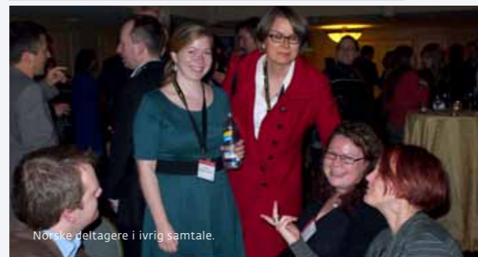
Norske deltagere i ivrig samtale.