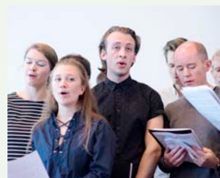
Korsang. Studenter og ansatte stilte opp i koret på MFs semesteråpningsgudstjeneste. Kantina var fullsatt av ansatte og studenter både under gudstjenesten og under den akademiske åpningen.