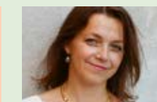
Vi lager barn Eivor Andersen Oftestad Frekk Forlag (2016)