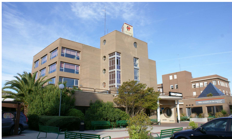
Centro de Humanización de la Salud (San Camilo) ligger i Tres Cantos, 22 km nord for Madrid. E-post: info@sancamilo.org . Hjemmeside: www.humanizar.es .