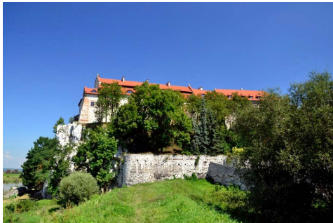
Benediktinerabbedit i Tyniec

komne sauene, og temaet var formulert som et spørsmål: ”Bare en sau?”. Det kunne tolkes på flere måter: ”Bare en sau?”, ”Bare én sau?”, ”Bare en sau?” Flertydigheten i spørsmålet var tilsiktet, og liknelsen ble satt inn i hørselshemmedes situasjon i menigheter og andre kristne sammenhenger. Gjennom foredrag og samtaler framkom det at svært mange hørselshemmede velger å trekke seg ut av menighetsfelleskapene fordi de faller utenfor både i gudstjenester og i sosiale sammenhenger. I mange tilfeller møter de fordommer og blir sett ned på fordi de grunnet