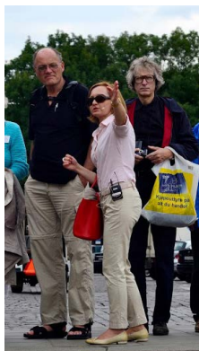
De norske representantene på omvisning i Kraków

La meg til slutt bare nevne at neste konferanse finner sted i Danmark i august 2016. Mer informasjon kommer både på IVSS Churchears hjemmesider og her i bladet i løpet av 2015.