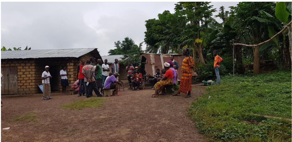
Morgenmøte om forfatters tilstedeværelse i Boway.

I likhet med andre landsbyer i Liberia som befinner seg et stykke unna et urbant liv, har landsbyen Boway tidligere hatt store utfordringer med tilgang til helsetjeneste. Befolkningen har levd under dårlig omstendigheter når det gjelder tilgang på helsetjeneste. Med over 9500 innbyggere med flere små landsbyer tett til seg, har nærmeste klinikken for lokalbefolkningen vært en annen landsby med en gangavstand på ca. fire timer (Bakgrunnsinformasjon, 2009). I søknaden til CODEVPRO beskriver Boway utfordringen med avstanden til klinikk som problematisk for gravide og syke. For å bringe gravide og syke til klinikken måtte disse personene enten bli båret på en rygg, i en trillebår eller hengekøye (Bakgrunnsinformasjon, 2009). Dagens tradisjonelle transportmiddel som kjøretøy var, og er fremdeles, vanskelig å få tak i, i landsbyen per dags dato. Kjøretøy er kun tilgjengelig for de som kommer seg inn til landsbyen.