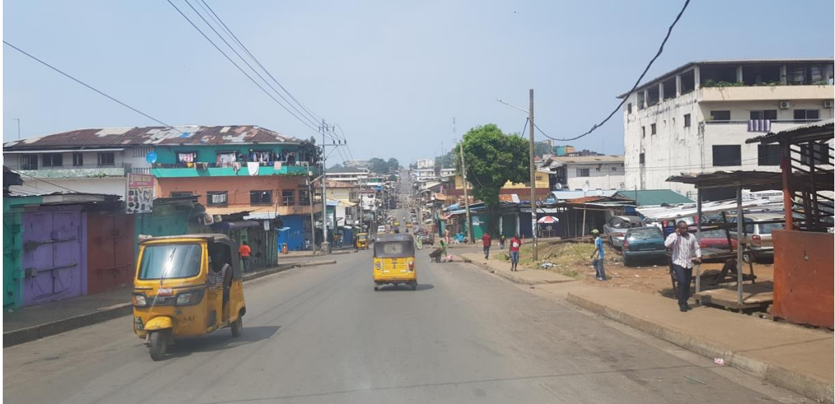
Monrovia, Liberia

I dette kapittelet skal jeg gi en bedre oversikt på bakgrunnshistorien til Liberia. Oversikten vil hjelpe med en bedre forståelse av livssituasjonen til innbyggerne i Vellei-Ta og Boway.