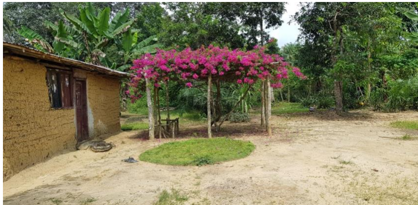
Uteområdet i Vellei-Ta.

Avledningsleder, Religion, skole og samfunn/Seksjonsleder ST/MV