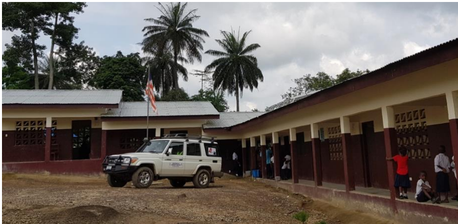
Velley-Ta Public Elementeray School.

Utenom skolen finnes det også et jordbruksprosjekt i landsbyen. Her har landsbyen fått en kvernemaskin som gjør det enklere å kverne kassavaen for lokalbefolkningen. Før de fikk kvernemaskinen tok det mye lenger tid å kverne kassavaen, fordi dette måtte gjøres for hånd. Dette førte ikke bare til lavere produksjon av kassava, men også helseskader på de som arbeidet. At de nå har en kvernemaskin har vært til stor hjelp for lokalsamfunnet og sørger for at de også kan kverne mer kassava på kortere tid. Kassavaen som kvernes blir omgjort til garri. Garri er et mel lignende pulver og kan spises som grøt eller tilsettes sammen med råvarer for å lage ulike matretter.