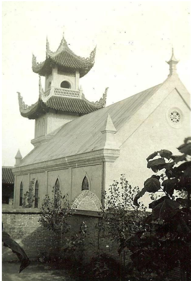
Kirken i Ankang