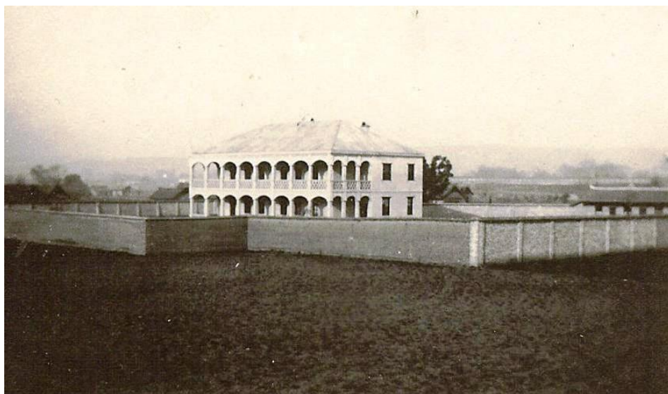
Misjonsstasjonen i Ankang

Misjonsarbeidet i Ankang ble drevet etter misjonsstasjon-metoden, Mye av arbeidet gikk ut fra misjonærenes bopel. Misjonsstasjonen var et stort hus med solide murer rundt. Dette gav en grunnleggende trygghet for misjonærfamiliene i usikre omgivelser. I tillegg søkte lokalbefolkningen inn dit i farefulle situasjoner. Ut fra stasjonen vokste arbeidet med kirke, kapeller, skoler, sykehus, klinikker og annet diakonalt besøksarbeid. Lokale kinesere ble etter behov ansatt for å fylle roller og behov, og disse ble kjernene i menighetene. I stasjonsmetoden var det ofte slik at ledelsen av alt arbeidet forble hos misjonærene, slik var det også i Ankang. 97