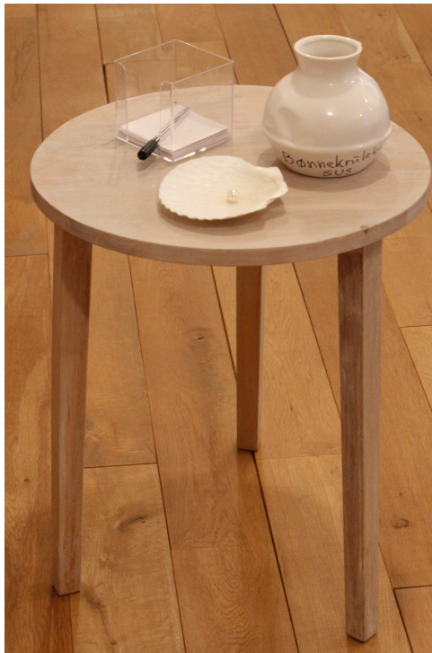
Bønnekrukke Kirkesalen, SUS

Gud vet hva det gjelder. Hvis du ikke vil at andre skal lese bønnen, kan du brette lappen godt sammen. Bønnekrukken løftes frem under forbønnen i søndagens gudstjeneste.