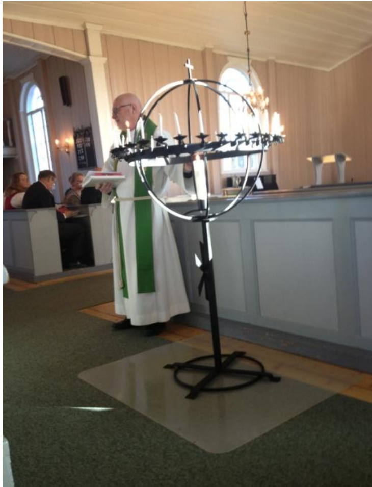
Bilde 4.3.2 Sognepresten i Byberg menighet presenterer lysgloben for menigheten i Vik kirke og forteller om hvordan den kan brukes.

forteller at globen er gitt av en anonym giver. Han forklarer om hvordan den kan brukes, at man kan komme fram og tenne lys for noen man tenker på, noe man ber for eller noen man er glad i. Han forteller videre at de er glade for å ha fått globen og at det var veldig fint at den kom nå før allehelgensdag. Presten inviterer til å komme til kirken på allehelgensdag for å tenne lys for en man tenker på.