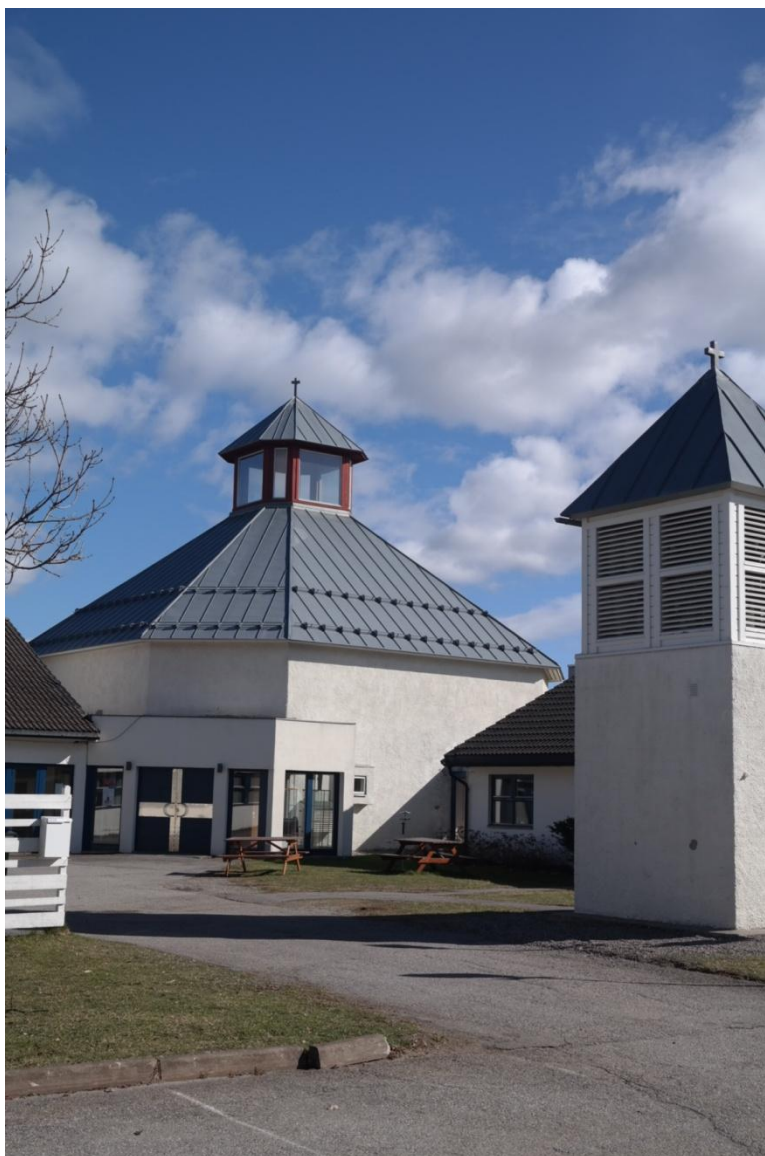
Bilde 4.1.1 Byberg kirke, arbeidskirke fra 1984

I denne kirken er lysgloben plassert i midten av benkeradene, på menighetens høyre side og er noe av det første man møter i kirkerommet når en kommer inn til gudstjeneste. Det er tidlig juni og fire barn skal døpes. Fem lys ble tent denne søndagen. Det første lyset ble tent av en ansatt i kirken før gudstjenesten startet. En ung pike tente et lys i det hun kom inn i kirkerommet. Et eldre par, mann og kvinne, tenner et lys, de tar seg god tid før de setter seg. De tente lys da de kom inn i kirkerommet og gikk deretter og satte seg i menigheten. Det siste lyset ble tent av en eldre dame. Hun tente lyset like etter hun kom inn i kirkerommet, gikk deretter og satte seg. Det var ingen annonsering/opplysning fra presten om bruken av globen ved denne gudstjenesten.