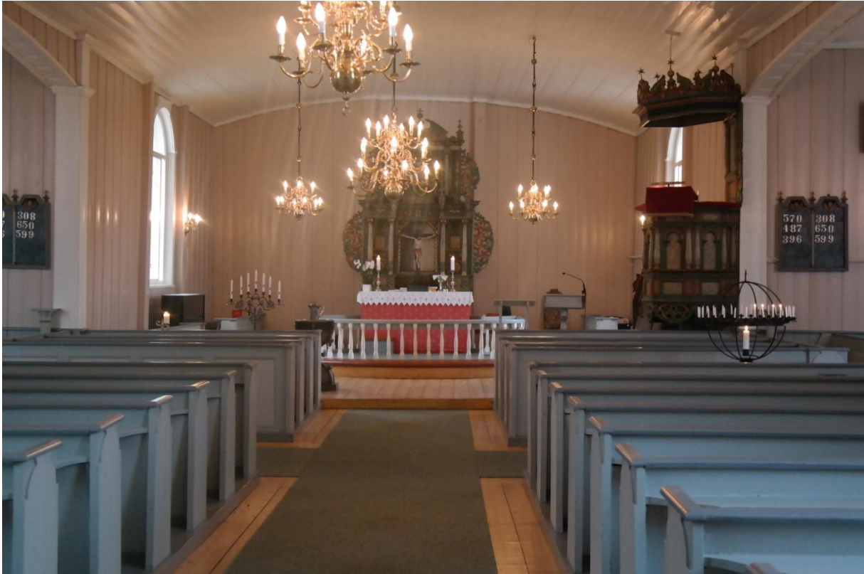
Bilde 4.3.3 Lysgloben i Vik kirke er plassert framme i kirken, til høyre.

Det nærmer seg slutten av oktober og jeg er tilbake i Vik kirke. Denne søndagen er det 104 mennesker som deltar på søndagsgudstjeneste. Det er bots og bededag, men det kommer litt i annen rekke da det både er nattverd og dåp i kirken denne søndagen. Seks lys tennes før gudstjenesten, og tre lys tennes etter gudstjenesten er ferdig. Det første lyset tennes av en ansatt i kirken. Hun bøyer hodet og står stille noen minutter etter at lyset er tent. Deretter kommer en kvinne mot lysgloben, hun går med langsomme og bestemte skritt. Hun tenner lys, folder hendene sine og blir stående lenge før hun setter seg i benkeraden. Så kommer det en kvinne til. Hun tenner først et lys, så et til. Hun ser rett på lysene, står helt stille, går så og setter seg. Deretter kommer en eldre mann og tenner et lys. Han er rask, og da lyset er tent går han mot benkeraden og setter seg. Under nattverden er det en kvinne som velger å tenne lys. Hun gjør dette på vei tilbake etter nattverd er gjennomført. Hun tenner lyset og vandrer videre til benkeraden. Etter gudstjenesten kommer det som kan se ut som tre generasjoner, en liten pike, hennes mor og mormor. De går frem til lysgloben og tenner hvert sitt lys. Da lysene er tent, holder de hverandre i hendene mens de ser på lysene. De blir stående. Etter hvert bryter de opp, ser på hverandre og så går de ut av kirkerommet.