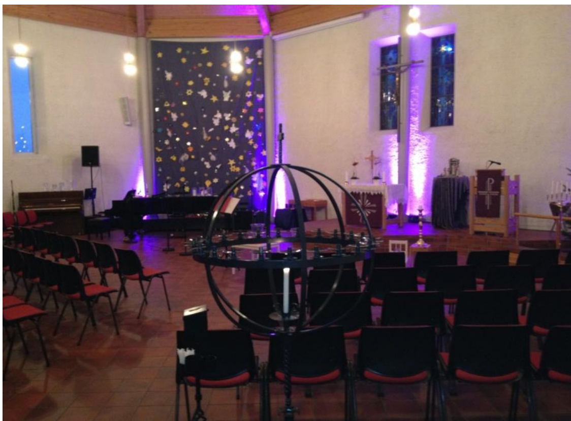
Bilde 4.1.2 Lysglobens plassering i Byberg kirke