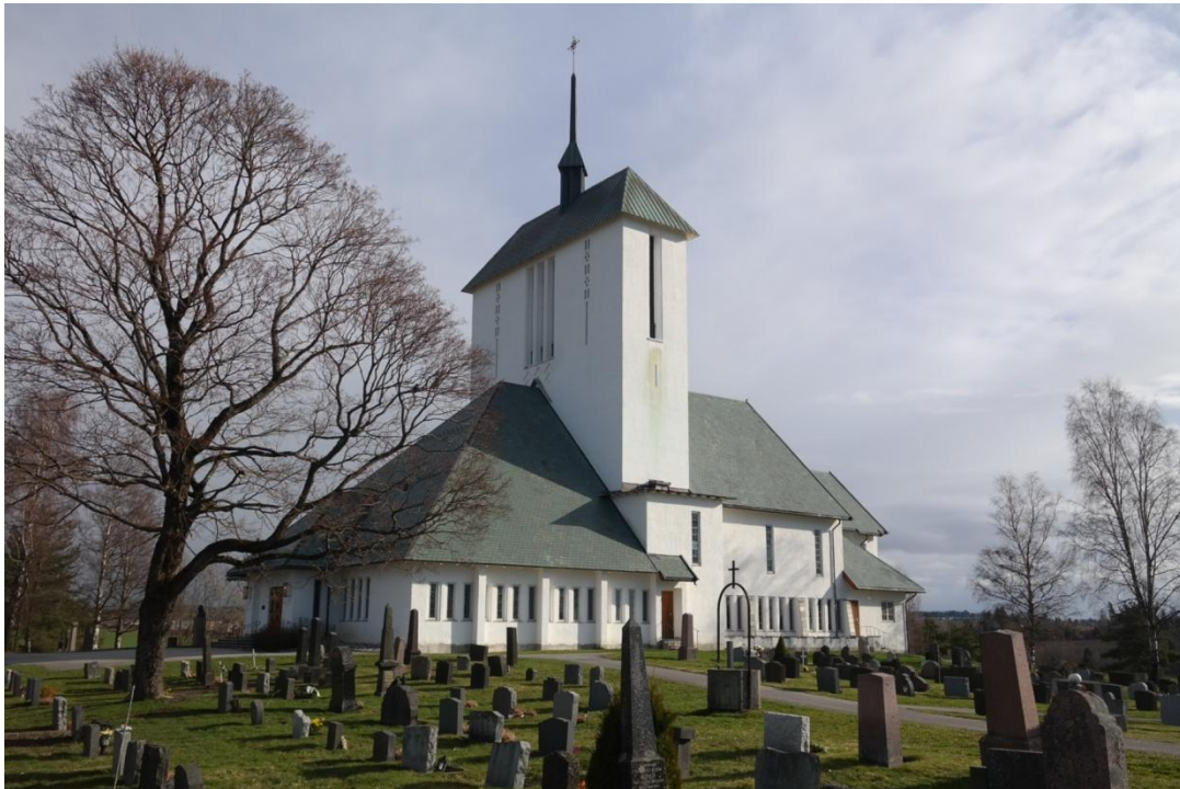
Bilde 4.2.1 Bakke kirke, langkirke fra 1958

Det er søndagsgudstjeneste tidlig i oktober. Lyset i midten av lysgloben er tent da jeg kommer 30 minutter før gudstjenesten starter. Jeg får siden vite at det er kirketjeneren som har tent lyset og gjort lysgloben klar til bruk. Jeg er først inn, ingen andre gudstjenestedeltakere er kommet ennå, men det er mye aktivitet i kirkerommet. Presten og flere menighetsarbeidere er opptatt med å tenne lys, ta lydprøver og legge de siste planene før gudstjenesten starter. Organisten og solisten tar en siste finpuss før kirkerommet fylles opp av menigheten som i dag blant annet består av fem dåpsbarn og deres følge. Globen er plassert på høyre side bak i kirken. Den står bak alle benkeradene og man får øye på den med en gang man kommer inn i kirkerommet. Globen står inntil en vegg, men det er god plass til å stå rundt den for å tenne lys og den er likevel tilgjengelig fra alle sider. Ved siden av lysgloben står et stativ med små hvite lys.