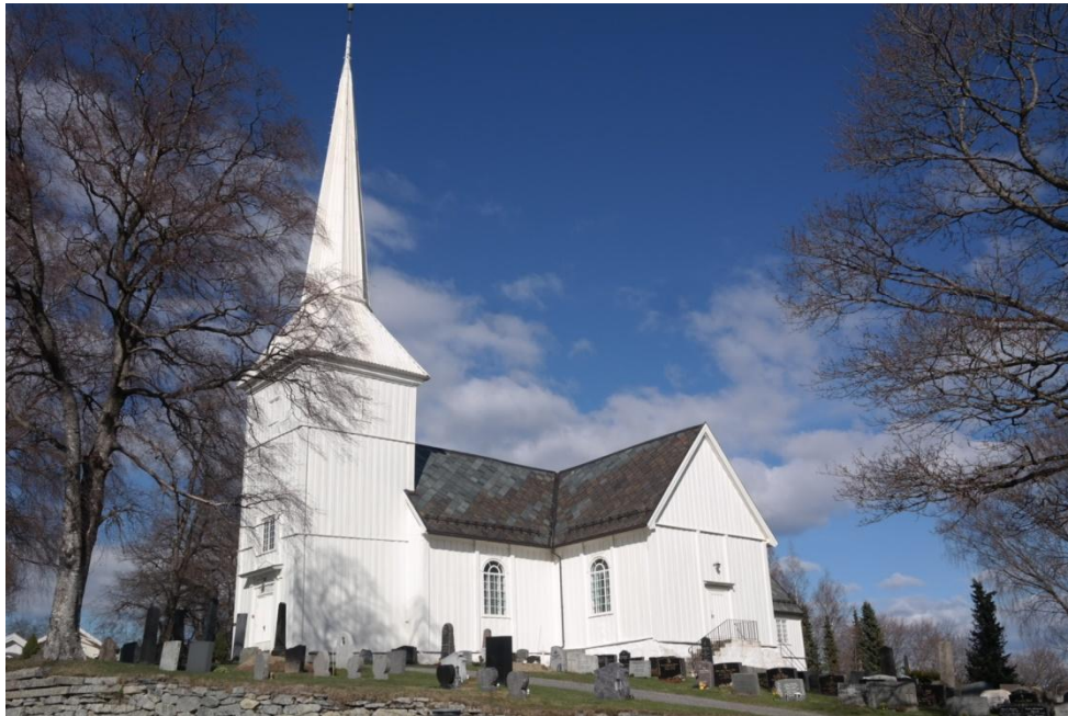
Bilde 4.3.1 Vik kirke, trekirke fra 1695

Det er søndag, medio oktober. Lysgloben i denne kirken er helt ny. Det er første gudstjenesten den står fremme. Da jeg kom til gudstjeneste denne søndagen, var to av menighetens ansatte i gang med å gjøre klar lysgloben. Lysene settes i globen, både Kristuslyset og de små lysene. De har ingen boks eller stativ til å ha lysene i. De forteller at det har vært vanskelig å finne en god plassering til globen. Den kan ikke stå bak i kirken, da det er benker helt bak til veggen. Kirken er fredet og å fjerne benker vil derfor være en umulighet. Kirken er korsorganisert. De har derfor valgt å sette globen på midtgangens høyre side. Fra mitt ståsted ser dette ut som en god plassering.