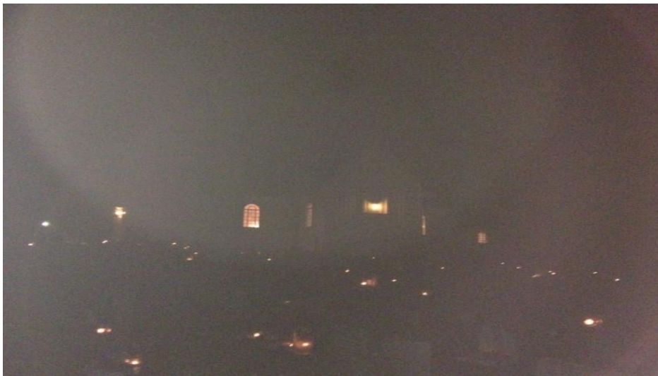
Bilde 4.3.5 Fra gravlunden ved Vik kirke, allehelgensøndag 3.11.2013

Allehelgensøndag i Vik kirke, lysgloben er full av lys selv om gudstjenesten er over. Denne søndagen deltok 250 mennesker som på gudstjenesten klokken 19.00. Fra klokken 13.00 var kirken åpen for de som ville tenne lys. Det var 80 mennesker som kom i løpet av den tiden kirken var åpen, før allehelgengudstjenesten startet.