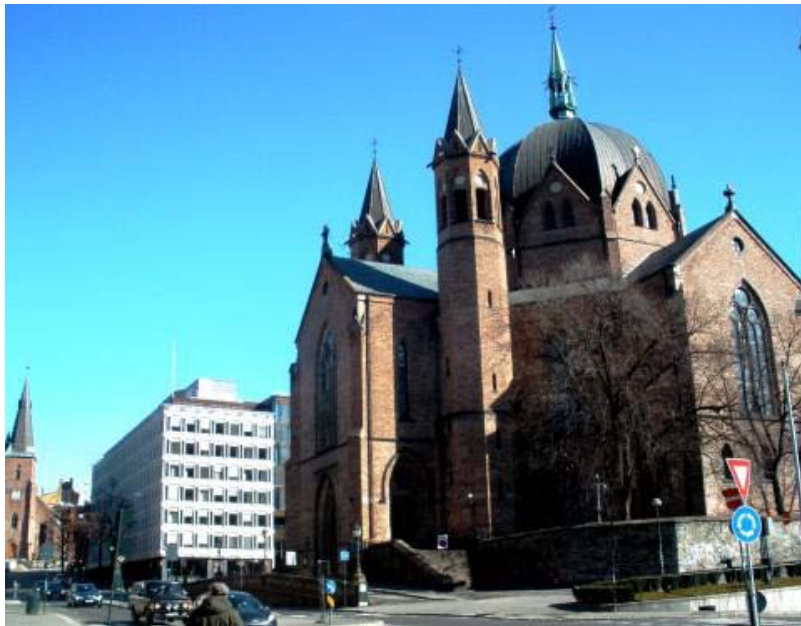
Trefoldighetskirken, med St.Olav katolske domkirke i bakgrunnen.

Trefoldighetskirken ligger sentralt i Oslo, i bydel St.Hanshaugen. Rundt seg har den St.Olav katolske domkirke, Deichmanske Bibliotek og Regjeringskvartalet.