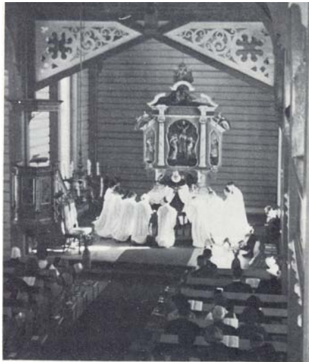
Konfirmasjon for Trastad-ungdom i Kvæfjord kirke.

utviklingshemmede blir konfirmert. Man sliter fremdeles med integrering av utviklingshemmede i Den norske kirke, men det er likevel ikke uvanlig med konfirmasjon for denne gruppen.