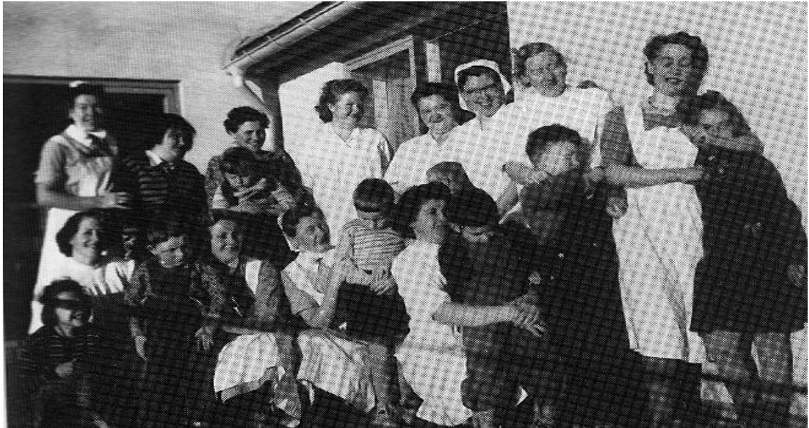
Bildet er fra paviljong 1, Solgården på Trastad. De første barna og pleierne, 1954, bildet hentet fra Johansen s 11.