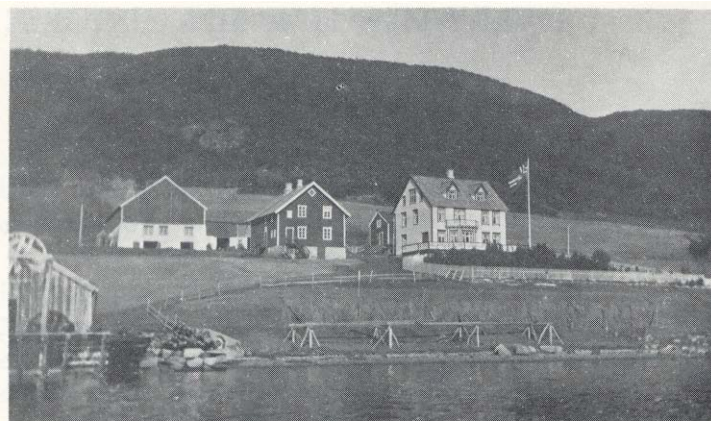
Trastad Gård før den første paviljongen ble reist.

Bilde av den opprinnelige Trastad gård, hentet fra Rødahl 1972, s 30.