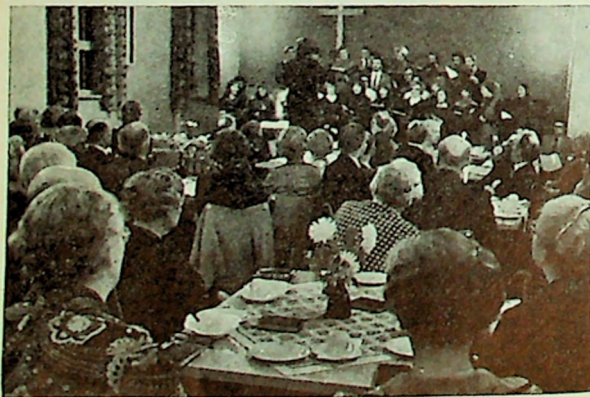
MF's studentkor i Sandar menighetshus under Vestfold-aksjonen.