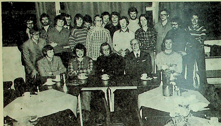
Biskop Weider midt i flokken av studenter fra Sør-Hålogaland.