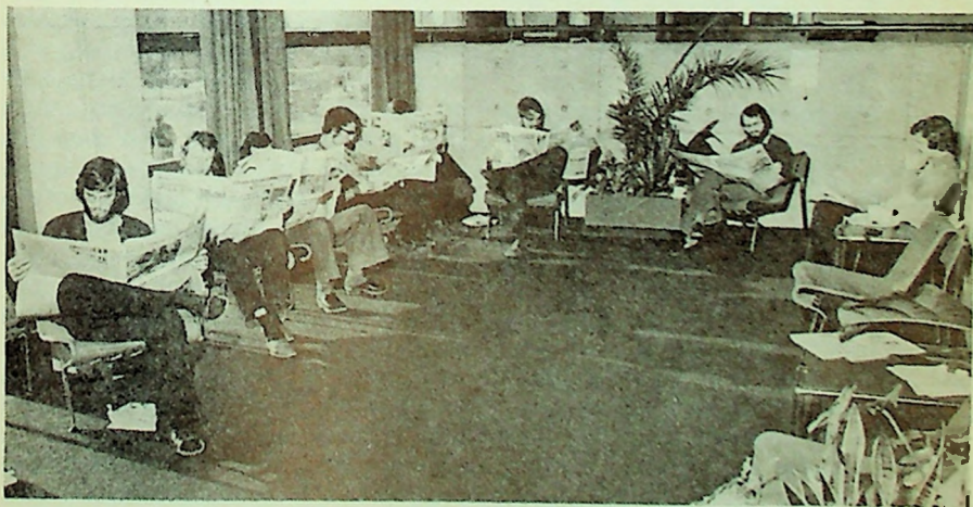
Avlsrommet er flittig i bruk.